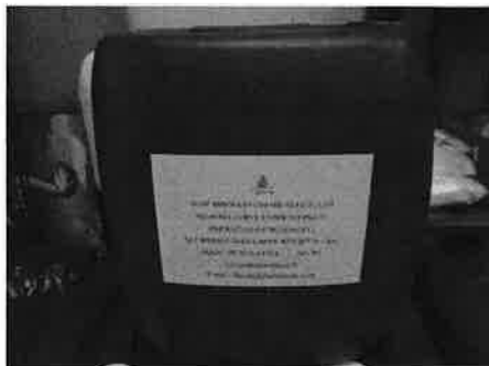
กลีเซอรินแบบถังเล็ก 30 Kg