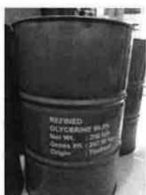
กลีเซอริน บริสุทธิ์ 99.87 % ผลิตจากปาล์ม 100% เหมาะ สำหรับอุตสาหกรรม อาหาร และ เครื่องสำอาง

ชื่อทางเคมีกลีเซอรินบริสุทธิ์ 99.5% (USP Grade)