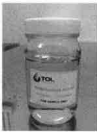
กลีเซอรินตัวอย่าง